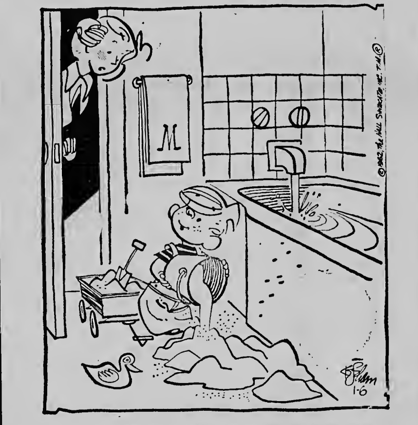
Ta maishi mi ta basha p'e pover bestia por come, mama.